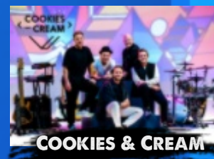
COOKIES & CREAM